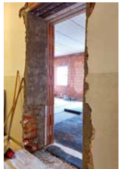
rasche Umsetzung des Bauvorhabens während der Sommerferien