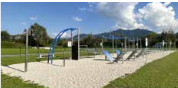
Freizeitsee - Ninja-Warrior-Anlage

Sämtliche Spielplätze müssen in einem den Normen entsprechenden Zustand gehalten werden, sodass Verletzungsgefahren ausgeschlossen werden können. Diesbezüglich werden alljährlich Überprüfungen vom TÜV Austria durchgeführt. Das Kontrollorgan des TÜV Austria hat der Marktgemeinde Krieglach wiederum ein großes Lob