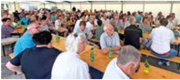
viele Gäste konnten zum Festakt begrüßt werden