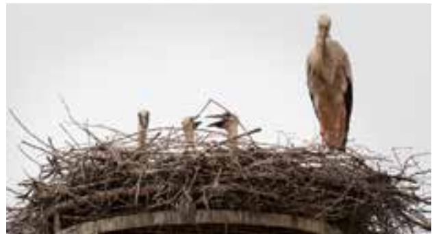
Jungstörche mit Altstorch