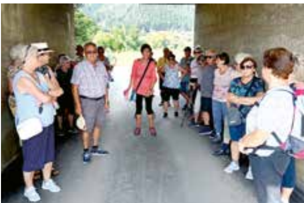
Besichtigung der Baustelle - Mürzstraße