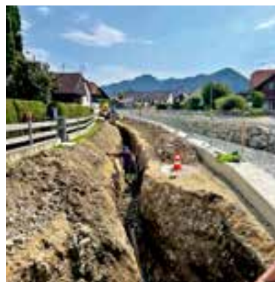
abschnittsweise Erneuerung der Gemeindewasserleitung

Wir haben als Verantwortungs-träger der Marktgemeinde Krieglach schon früh erkannt, wie wichtig Hochwasserschutz-einrichtungen sind, und haben in den letzten 30 Jahren sehr viel Geld in den Ausbau dieser Schutz-einrichtungen investiert, um die Bevölkerung bestmöglichst vor Hochwasser zu schützen!