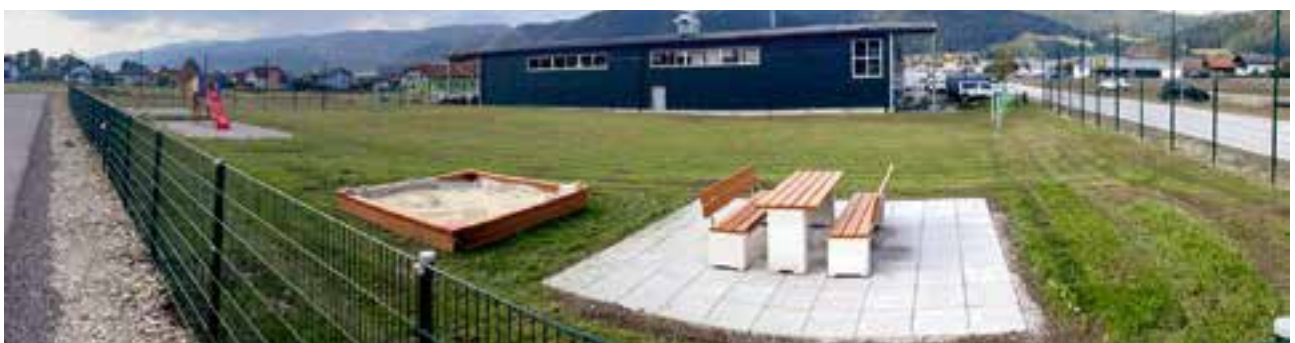
Spielplatz Gartengasse - NEU