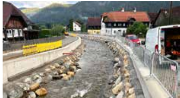
aufwändiger und optisch ansprechender Ausbau des Freßnitzbachs

einem modernen Kommunikationssystem erhalten alle maßgeblichen Dienststellen der Behörden, sofern ein Hochwasserereignis eintritt, eine entsprechende Nachricht.