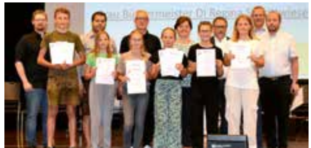
Verleihung der Jungmusiker-Leistungsabzeichen Teil 2