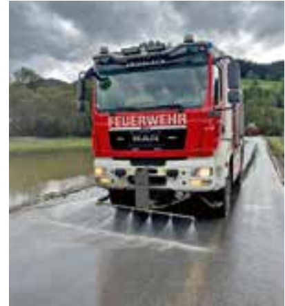
Reinigung der Malleistenstraße