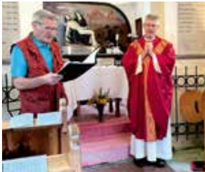
Heilige Messe in der Alpler Heldenkapelle

griff „Kettenfeier“ zeitweise wie einen Zweitnamen, dieser erinnert an die Befreiung des Apostels Petrus von seinen Ketten durch einen Engel. Witterungsbedingt fand heuer die hlg. Messe direkt in der Heldenkapelle statt.