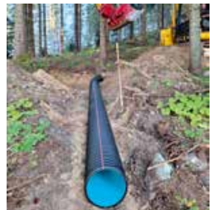
Sanierung der Hofzufahrten und Erneuerung der Durchlässe zur Ableitung des Oberflächenwassers