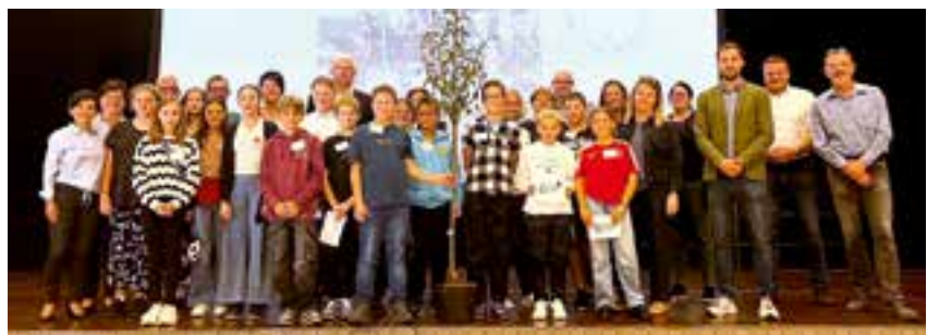
der Kindergemeinderat mit dem Erwachsenengemeinderat