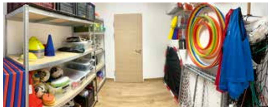
Lehrergarderobe und Lehrmittelraum für den Turnunterricht

Mit der Sanierung der Sanitärbereiche erfolgte auch die Generalsanierung der Garderobengebiete , die nun, nach Abschluss der Arbeiten, im neuen Glanz den Pädagogen sowie den Schülern zur Verfügung stehen. Im Turnsaal musste die gesamte Lüftung einer Sanierung und Generalwartung un-