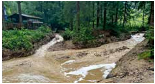
Brennerbach – zweiarmer Zufluss zum Rückhaltebecken

steiniges Material) gefüllt wurde. Der Brennerbach , wo ebenfalls ein kleineres Rückhaltebecken dafür sorgt, dass das Geschiebe nicht in die darunter liegende Siedlung gelangt, wurde bei diesem Starkregenereignis vom 16. auf den 17. Juli ebenfalls randvoll mit Geschiebe gefüllt. Auch beim Steinbach (Malleisten) wurde das Rückhaltebecken zur Gänze angefüllt und ein Teil des Geschiebes wurde weiter in Richtung der Einmündung in eines öffentlichen Gerinnes neben der Mürz verfrachtet, wo eine Brücke verlegt wurde.