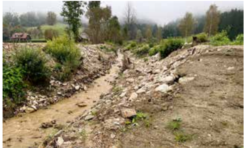
Räumung – Steinbach

diesen beiden Tagen alle Begehungen und Schadenserkundungen mit den technischen Sachverständigen der Lawinen- und Wildbachverbauung sowie des Landes Steiermark statt.