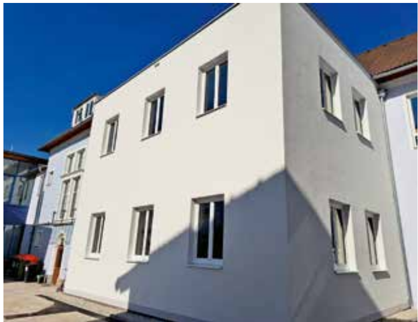
fertiggestellter Zubau für die Allgemeine Sonderschule

Die besondere Herausforderung bestand darin, dass die gesamten Arbeiten kurz vor Schulschluss gestartet wurden