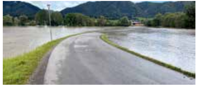
Überflutungsfläche – Nähe Lippbauerbrücke