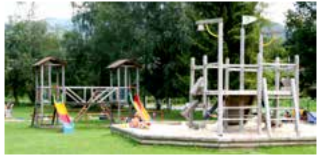
Freizeitsee - Spielplatz