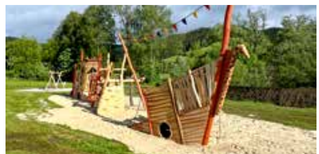
Freizeitsee - Piratenschiff und Schaukelanlage beim Naturbadeteich