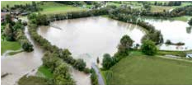
Die Lastenstraße und Malleistenstraße waren für einen Tag nicht passierbar