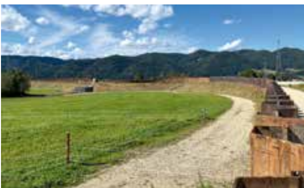
Fertigstellung der Rückhaltebeckenvergrößerung mittels Spundwänden