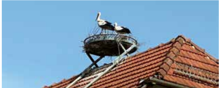
Altstörche im Horst auf dem Csamay-Haus

Am 21. März kam die Störchin, die schon seit 2021 in Krieglach brütet und einen Ring der slowenischen Vogelwarte Ljubljana trägt, aus dem afrikanischen