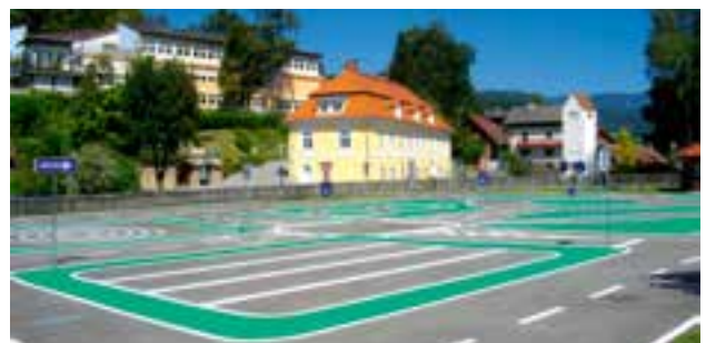
Jugend- und Familienfreizeitanlage: Verkehrserziehungspark