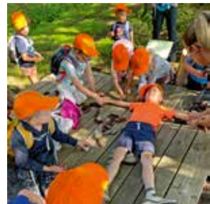
Körpergrenzen wahrnehmen im Wald der Sinne