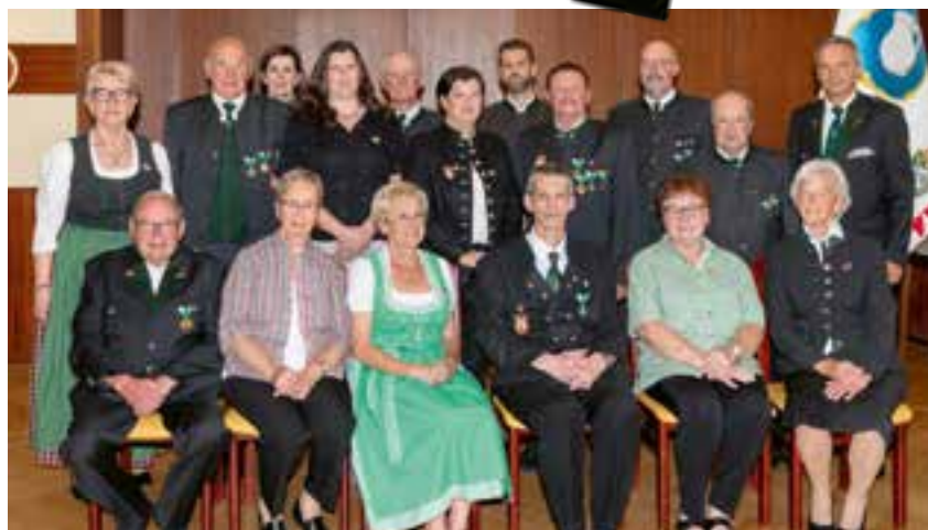
die im Rahmen der Generalversammlung geehrten Mitglieder des ÖKB OV Krieglach