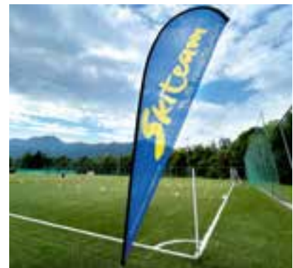
... für die Schüler

Im Zuge des Nachmittagsprogramms des Familiensporttages war das SKITEAM mit einem Ski- bzw. Carving-Simulator und einem Geschicklichkeitsparcours vertreten. Besonders der Simulator hat es den Kindern und Jugendlichen angetan;