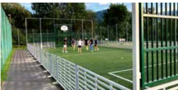
Jugend- und Familienfreizeitanlage: Funcourt

Die Errichtung der Ninja-Warrior-Anlage und des Calisthenics-Parks wurden aufgrund der Vergrößerung des Freizeitseegebietes infolge eines Grundstückstauschs mit der Fa. Kohlbacher möglich. Diese beiden sehr modernen Anlagen sollen nicht nur die Kinder und Jugendlichen, sondern auch alle Junggebliebenen zur Bewegung und Gymnastik animieren. Die große Spielanlage in Form eines Piratenschiffs unweit des Naturbadeteichs bietet den Kindern viele Möglichkeiten und wird