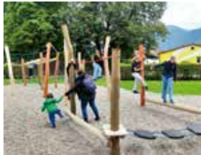
der neue Seiledschungel wurde von den Kindergemeinderäten gleich probiert