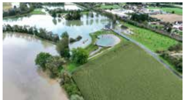
Freizeitsee – Luftbild