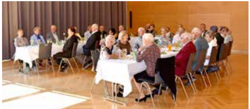
Jubilarfeier im September