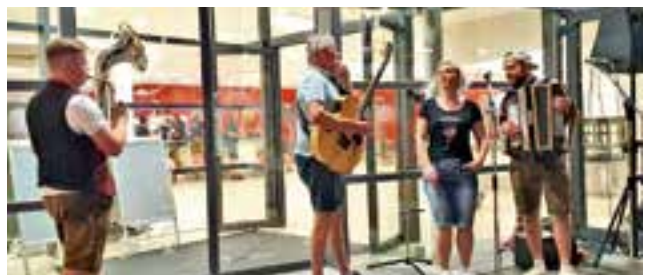
Besucherrekord mit Musikantentreffen im Juli