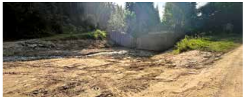
mehr als 1.000 m 3 Geschiebe wurden beim Ausschotterungsbecken Rittisbach entfernt

becken beim Rittisbach mit rd. 1.000 m 3 Geschiebe (Sand und