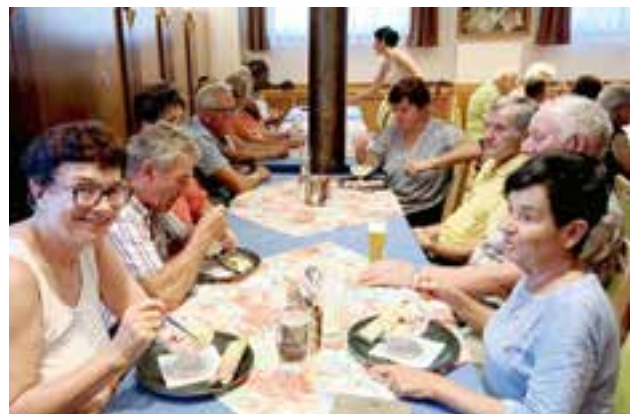
gemütlicher Ausklang beim Gasthof Stocker