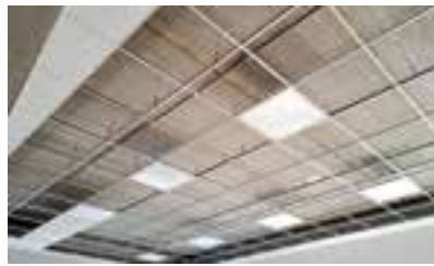
Schallschutzdecke mit integrierter Beleuchtung

Die Gesamtkosten werden rund € 500.000,00 betragen und diese Kosten werden entsprechend der jeweiligen Finanzkraft, der Einwohnerzahl und der ASO-Schüler unter den Gemeinden des ehemaligen Bezirks Mürzzuschlag aufgeteilt. Wir freuen uns, dass unsere