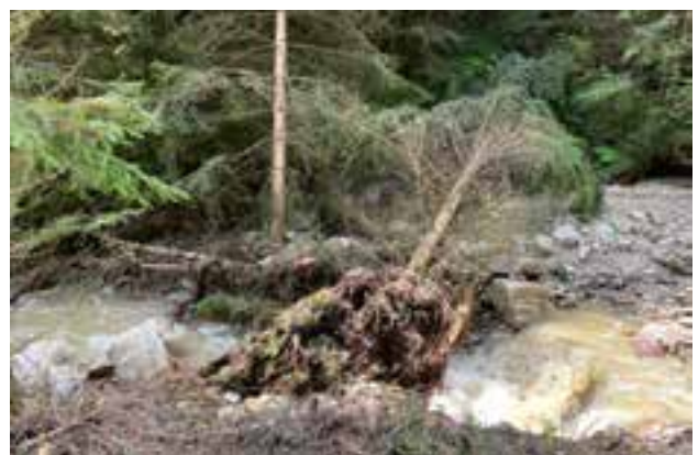
Steinbach – Rückhaltebecken