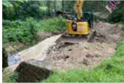
Brennerbach – Räumung des Rückhaltebeckens

steiniges Material) gefüllt wurde. Der Brennerbach , wo ebenfalls ein kleineres Rückhaltebecken dafür sorgt, dass das Geschiebe nicht in die darunter liegende Siedlung gelangt, wurde bei diesem Starkregenereignis vom 16. auf den 17. Juli ebenfalls randvoll mit Geschiebe gefüllt. Auch beim Steinbach (Malleisten) wurde das Rückhaltebecken zur Gänze angefüllt und ein Teil des Geschiebes wurde weiter in Richtung der Einmündung in eines öffentlichen Gerinnes neben der Mürz verfrachtet, wo eine Brücke verlegt wurde.