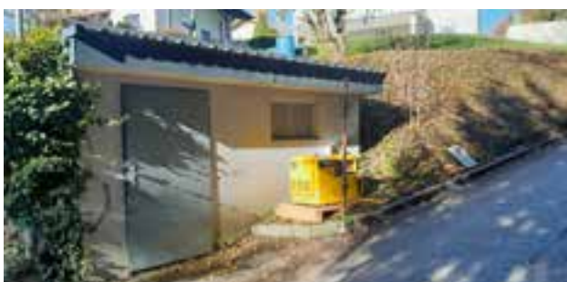
Pumpstation Alter Sommer