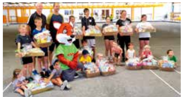
Gewinner der Geschenkkörbe von der Marktgemeinde Krieglach