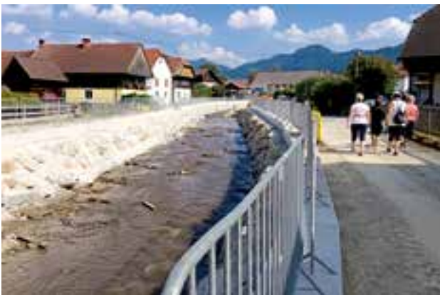
Besichtigung Hochwasserschutzverbauung Freßnitz Ort

Zurück ging es über die Hochfeldstraße, vorbei am Biotop, die Westsiedlung zum Gasthof Stocker, wo die Wanderer zu einer kleinen Jause eingeladen wurden und den Nachmittag gemütlich ausklingen ließen.