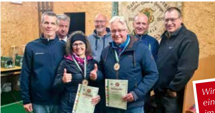
die glücklichen Gewinner mit den Gratulanten

Erfreulich war, dass trotz des außergewöhnlich kalten Wetters, wenigstens zwei Gewinner den Weg zur Siegerehrung gefunden haben.