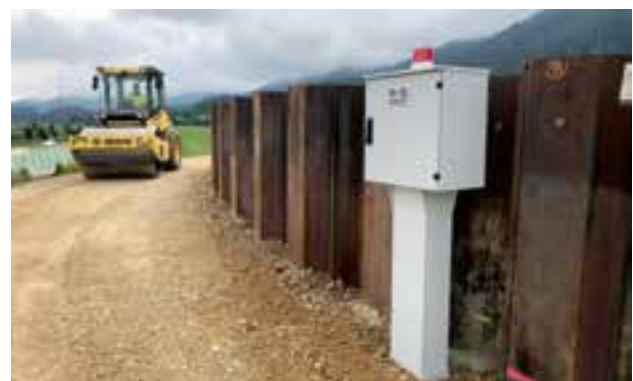
Inbetriebnahme der elektronischen Klappensteuerung

Die Bauarbeiten zur Realisierung des Hochwasserschutzes Freßnitzbach schreiten zügig voran und wir dürfen uns im Vorfeld bei allen Projektverantwortlichen und der Baufirma PORR für den vorbildlichen