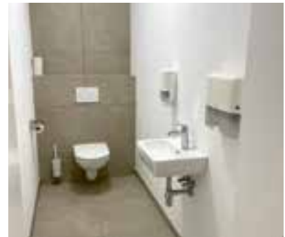
die Duschen, WCs und die Garderoben wurden modern und zweckmäßig gestaltet

Die Marktgemeinde Krieglach investiert Jahr für Jahr große Summen in die Erhaltung und Erneuerung der Bildungseinrichtungen.