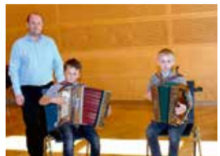
musikalische Umrahmung durch die Musikschule Krieglach