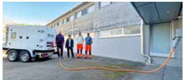
Notstromversorgung im Gemeinde- und Veranstaltungszentrum sowie im Sportzentrum