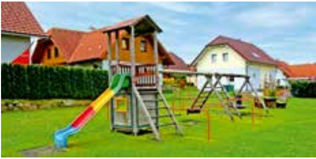
Spielplatz - Aichfeld-West