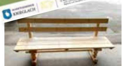
Sitzgelegenheiten aus heimischem Holz laden zum Rasten ein