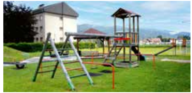
Spielplatz Dr. Max-Mell-Straße