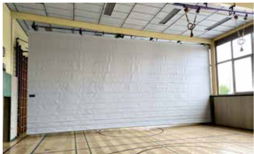
Trennwand für Mehrfachnutzung des Turnsaals in der Mittelschule

terzogen werden, sodass diese wieder ihre Funktion erfüllen kann. Darüber hinaus wurde der Turnsaal in der Mittelschule mit einem Trennvorhang , der elektrisch gesteuert werden kann, versehen. Der Grund liegt darin, dass der Turnsaal nicht nur von der Mittelschule sondern auch von den Kindergartengruppen genutzt wird. Aufgrund des nun installierten Trennvorhanges ist es möglich, dass zwei Kindergartengruppen gleichzeitig den Turnsaal benutzen können.