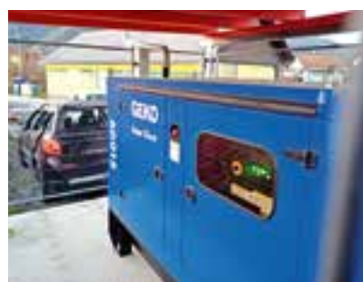
Notstromaggregat FF Freßnitz

Nur für den Betrieb der beiden Pumpstationen am Alter Sommer und im Wassertal mussten eigene Notstromaggregate angeschafft bzw. die Pumpstationen entsprechend adaptiert werden , sodass im Falle eines Blackouts, auch diese sofort angeschlossen werden können und die Wasserversorgung auch in diesen Bereichen aufrechterhalten werden kann.