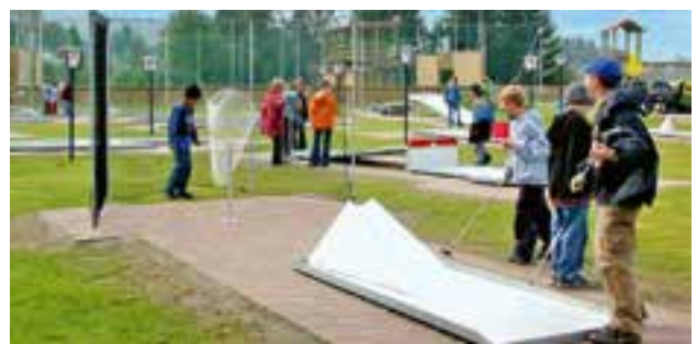
Jugend- und Familienfreizeitanlage: Minigolf