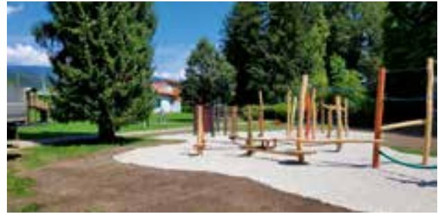
Seiledschungel im Roseggerpark

Die Marktgemeinde Krieglach ist für insgesamt zehn öffentliche Kinderspielplätze im Gemeindegebiet verantwortlich.