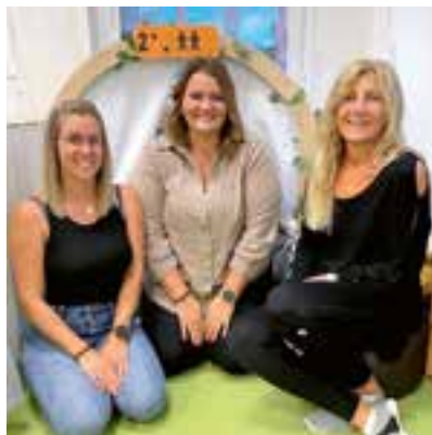
das Team des Heilpädagogischen Kindergartens

Das zuständige Team erstellt für jedes Betreuungskind einen individuellen Förderplan nach dem dieses dann kontinuierlich in seinem Kindergarten, entsprechend des Entwicklungsstandes, in allen Bereichen gefördert, unterstützt und begleitet wird. Eine regelmäßige und gute Zusammenarbeit mit Eltern und Kindergartenpersonal bildet hierfür die Basis.