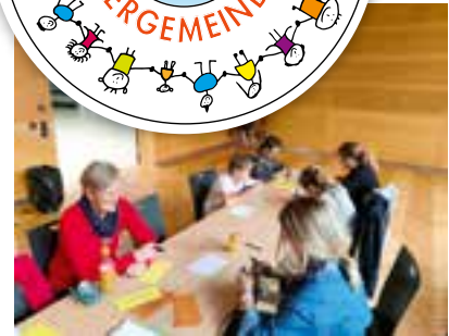
Vorbereitung auf die gemeinsame Sitzung mit dem Erwachsenengemeinderat

Der Kindergemeinderat der Marktgemeinde Krieglach setzt die unterschiedlichsten Aktivitäten und arbeitet aktiv am Gemeindegeschehen mit. Der verantwortlichen Betreuerin, Frau GR in Franziska Holzer sowie dem gesamten Betreuersteam unseres Kindergemeinderates darf an dieser Stelle herzlich gedankt werden.