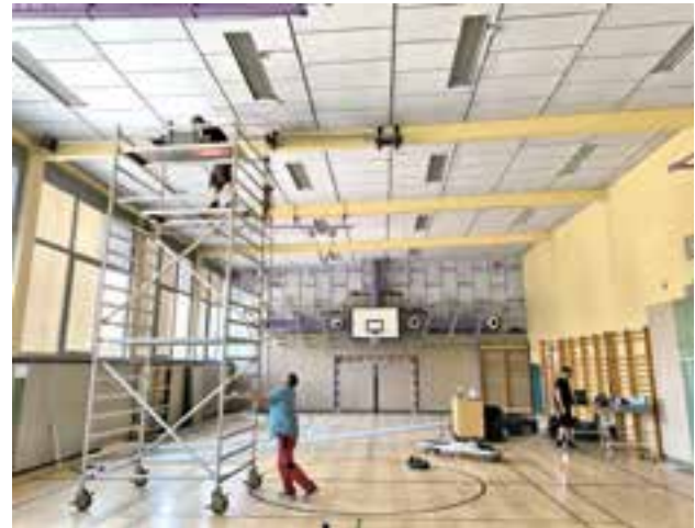
Montage der Akustikverkleidung sowie des Trennvorhanges

terzogen werden, sodass diese wieder ihre Funktion erfüllen kann. Darüber hinaus wurde der Turnsaal in der Mittelschule mit einem Trennvorhang , der elektrisch gesteuert werden kann, versehen. Der Grund liegt darin, dass der Turnsaal nicht nur von der Mittelschule sondern auch von den Kindergartengruppen genutzt wird. Aufgrund des nun installierten Trennvorhanges ist es möglich, dass zwei Kindergartengruppen gleichzeitig den Turnsaal benutzen können.