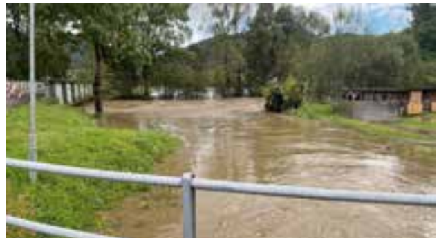
Mürz – Einmündung – Massingbach

hat sie sofort die Bauhofmitarbeiter wie auch die Feuerwehr alarmiert sowie mit den Kraftwerksverantwortlichen Kontakt aufgenommen um gemeinsam die Situation zu bewältigen. Das Hochwasser der Mürz konnte