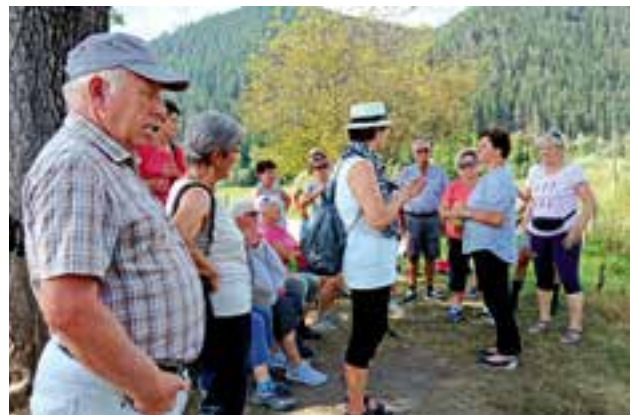
Besichtigung Freßnitzbach Unterlauf - Fertigstellung 2017