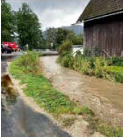
Massingbach – Bereich - Einfahrt Sommersiedlung - Massingbachbrücke

Ein besonderes Danke gilt unseren Mitarbeitern des Bauhofs sowie den Einsatzorganisationen, allen voran unseren drei Feuerwehren für die Einsatzbereitschaft und die geleistete Arbeit!