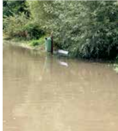
Radweg R5 – Sommersiedlung