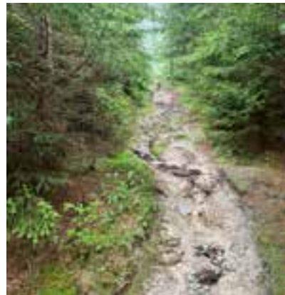
Waldwandelweg vor der Sanierung

Neben dem allgemein bekannten Weg (Forststraße) zum Geburtshaus am Alpl gibt es auch einen öffentlichen steileren Weg zum Geburtshaus, dieser zweigt von der Landesstraße (Nähe der öffentlichen WC-Anlage) ab. Dieser Weg war einerseits infolge massiver Ausschwemmungen und andererseits aufgrund des zunehmenden Bewuchses nur noch sehr schwer begehbar bzw. für Familien mit Kindern nicht geeignet.