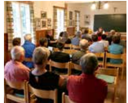
die Besucher wurden im ehemaligen Klassenzimmer in der Waldschule empfangen

Bei einer Begegnung bei Brot und Wein, zu der die Marktgemeinde Krieglach eingeladen hatte, fand die Veranstaltung einen geselligen Abschluss.