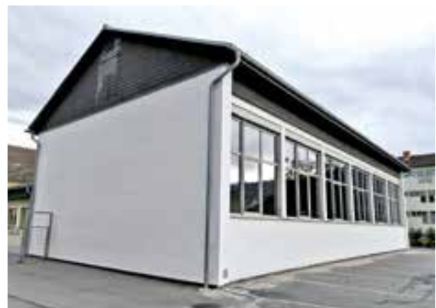
Dämmung und Neugestaltung der Turnsaal-Außenfassade