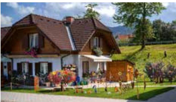
Komitee Behindertenhilfe Krieglach