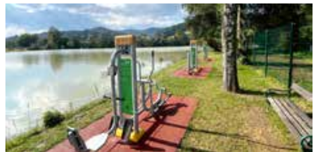
Freizeitsee - Outdoor-Fitness-Geräte