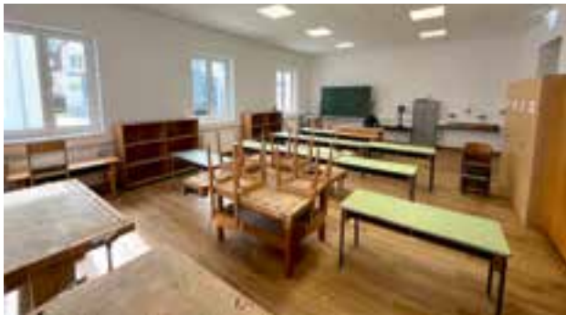
neues Klassenzimmer für den Werkunterricht

Gemeinde eine gesunde Altersstruktur aufweist, die Bevölkerungszahl gehalten werden kann, und dass junge Familien mit Kindern gerne in Krieglach bleiben oder zu uns kommen und unseren schönen Ort zu ihrem Wohnsitz wählen.