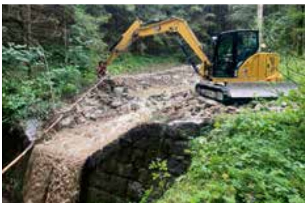
Steinbach – Rückhaltebecken

Am 17., 18. und 19. Juli wurden sämtliche Rückhaltebecken ausgebaggert und das Geschiebematerial auf den gemeindeeigenen Platz in der Werkstraße verbracht. Außerdem fanden an