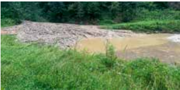
Rittisbach – Ausschotterungsbecken