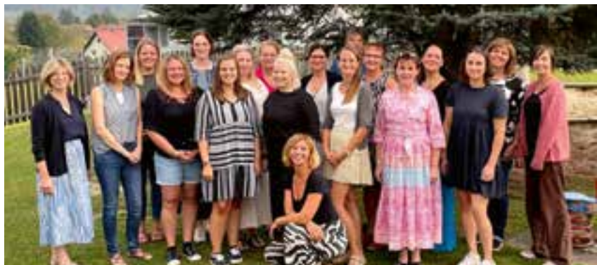
das Team des Heilpädagogischen Kindergartens und der sieben IZB-Teams

Die Eingewöhnung bei uns in der Integrationsgruppe verlief sehr entspannt und die Kinder haben sich in das Kindergarten-geschehen schnell eingelebt. Um sich einander besser kennenzulernen sangen wir viele verschiedene Lieder, spielten einige Spiele und erzählten die ersten, spannenden Geschichten.