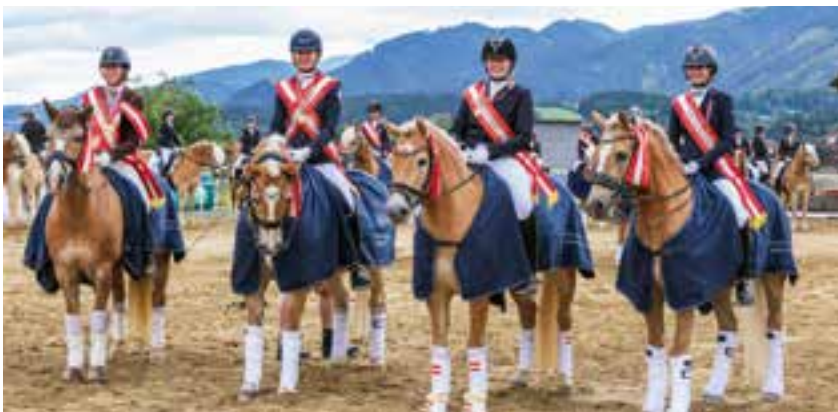
das Team Rainhof bei der Bundesmeisterschaft