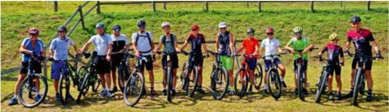
Radtour auf die Malleisten-Alm

auf der Malleisten Alm, bevor es zurück ins Tal ging. Das herrliche Sommerwetter rundete diesen wunderschönen und lustigen Radausflug perfekt ab.