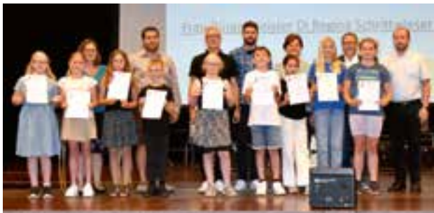
Verleihung der Jungmusiker-Leistungsabzeichen Teil 1