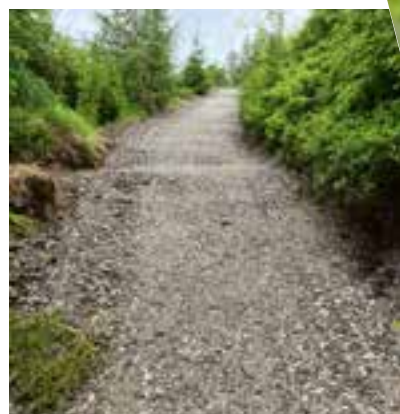
Waldwandelweg nach der Sanierung