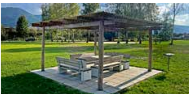
Freizeitsee - neue Sitzgelegenheit bei der Ninja-Warrior-Anlage