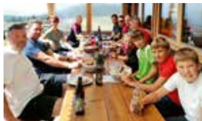
Jause auf der Hönigsbergalm

Im Vordergrund stand die Freude an der Bewegung und an der Gemeinschaft, sodass eine Teilnahme aller Altersgrup-