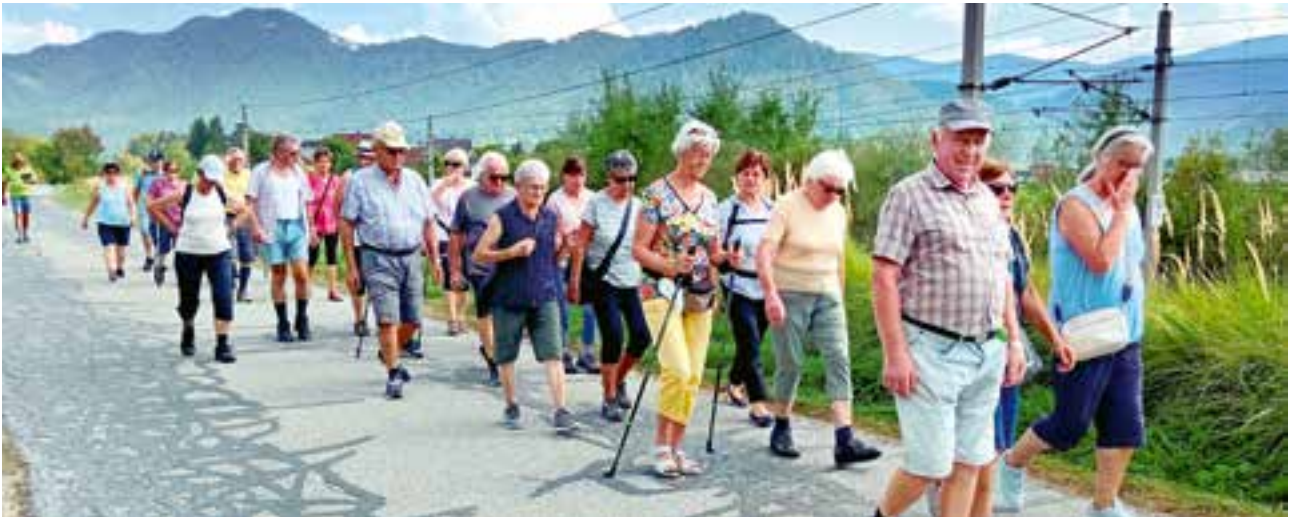
Wanderung Richtung Freßnitz über den Quarzweg

Die Marktgemeinde Krieglach hat damals das gesamte Hochwasserschutzprojekt, das im Rahmen des ÖBB-Brückenbaus bzw. der Errichtung der Lärmschutzwände umgesetzt wurde, vorfinanziert. Die Wanderer waren von den Leistungen, die