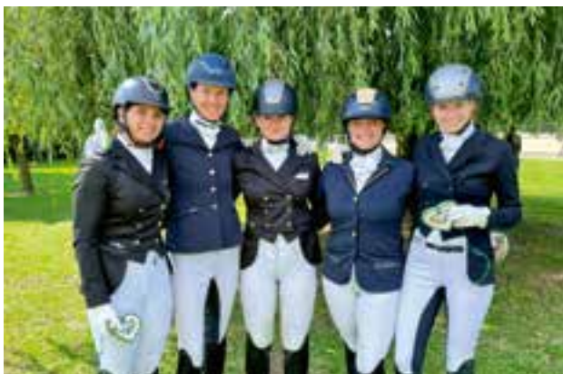
Team Rainhof am Auhof