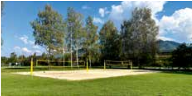
Freizeitsee - Beachvolleyballplätze