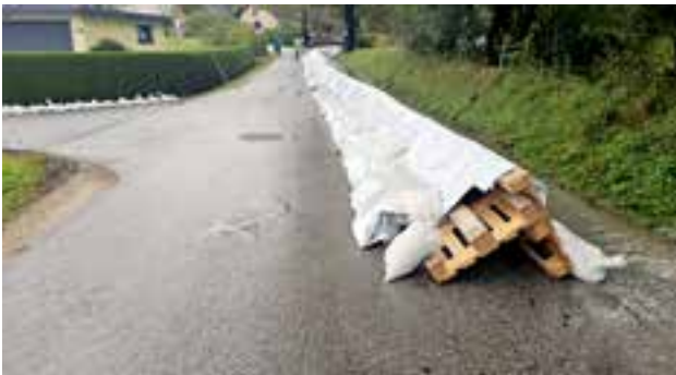
Errichtung eines Hochwasserdamms entlang der Malleistenstraße Einfahrt zu den Fam. Täubl