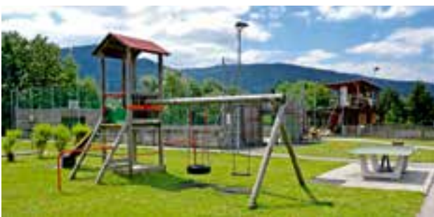
Jugend- und Familienfreizeitanlage: Spielplatz