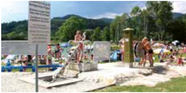
Freizeitsee - Wasserspielplatz