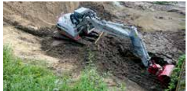
Rittisbach – Räumung des Ausschotterungsbeckens

In der Woche von 16. bis 20. Juli gingen in Krieglach einige schwere Gewitter mit starken Niederschlägen nieder. Heuer war die nordwestliche Seite von Krieglach besonders stark betroffen. Der Steinbach (Malleiten), der Brenner- und der Rittisbach haben infolge der starken Niederschläge, große Mengen an Geschiebe gebracht, die in weiterer Folge zu Problemen führten.