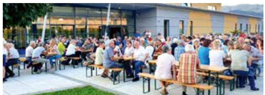
Abschluss mit den Original Fidelen Krieglachern beim Feierabend im August