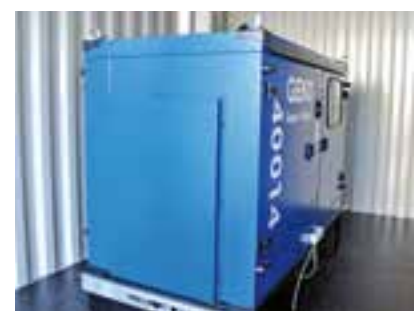
Notstromaggregat FF Krieglach