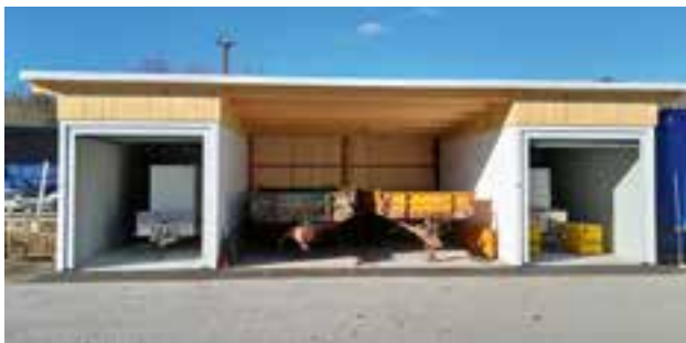
Errichtung von Garagen am Bauhof zum Einstellen der mobilen Aggregate