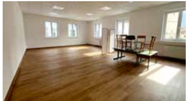
neuer Klassenraum für den Gruppenunterricht