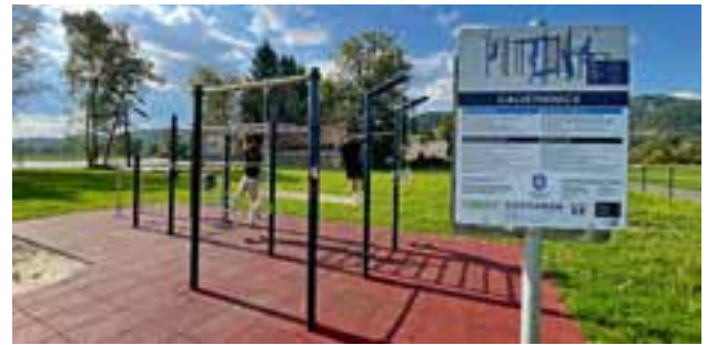
Freizeitsee - Calisthenics-Park

hervorragend angenommen. Die Arbeiten konnten in den Sommerferien abgeschlossen werden, sodass dieser den Kindern und Jugendlichen bereits in den Ferien zur Verfügung stand. Der neue großzügig angelegte Seilgartenspielplatz im Roseggerpark erfreut sich ebenfalls bereits größter Beliebtheit und stellt eine wunderbare Ergän-