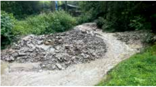
Brennerbach – Geschiebe