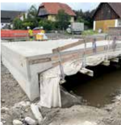
Neuerrichtung von Brücken und Übergängen

Höhe von € 1,5 Mio. aufbringen muss. In Anbetracht der jüngsten Hochwasserereignisse in Österreich können wir sehr froh und dankbar sein, dass wir in Krieglach nun mit der Errichtung des Hochwasserschutzes Freßnitzbach auch den Ortsteil Freßnitz schützen können. Auch bei uns hat es sich bei den Unwettern bzw. Starkregenereignissen im heurigen Jahr gezeigt, wie wichtig Hochwasserschutzbauten sind. Dies sowohl beim Rittisbach, beim Brennerbach wie auch beim Steinbach , wo die bereits bestehenden Rückhaltebecken die darunter liegenden Siedlungen von Geröll und Gesschiebe geschützt haben.