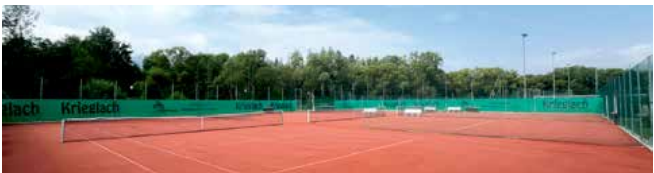
drei neue Red-Court-Plätze mit Schlagwand - die neuen Schmuckstücke auf der Tennisanlage