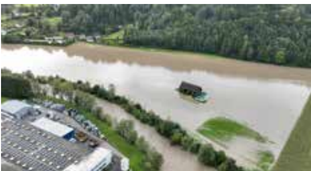
Überflutungsbereich – Sommersiedlung – Lenzbauerwiese