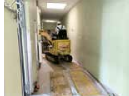
Generalsanierung der Sanitär- und Garderobengebiete