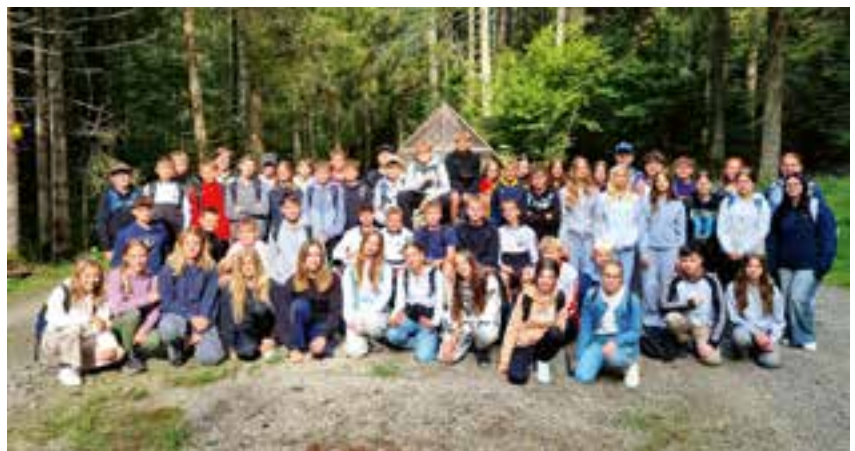
4a, 4b, 4c