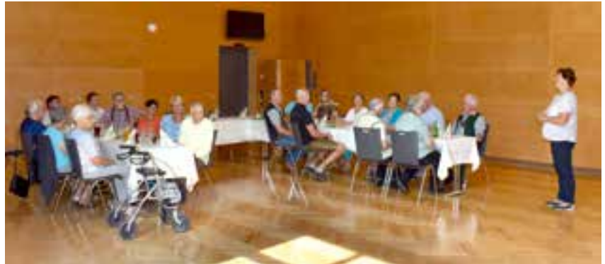
Jubilarfeier im August