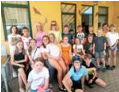
Abschluss Kindergemeinderat – Eis essen beim Fluderstüberl