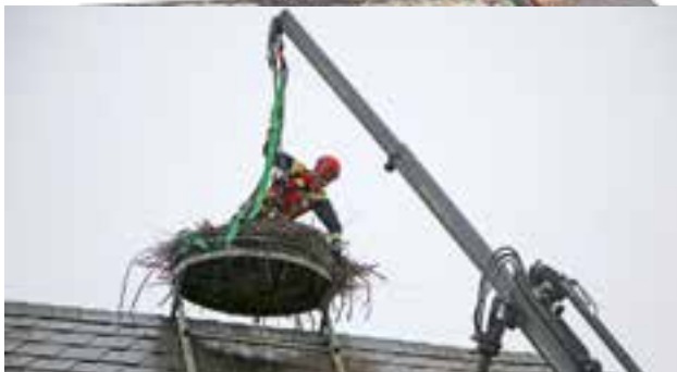
Umsiedlung des Storchenhorsts