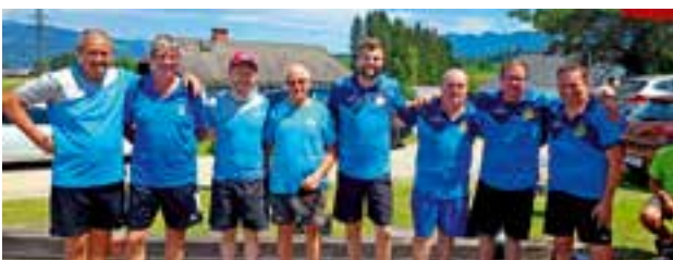
1. Platz – ESV Mürzsteg 2. Platz – ESV TUS Krieglach

Der 1. ESV Krieglach freut sich schon auf eine zahlreiche Beteiligung im neuen Jahr und wünscht allen viel Glück & vor allem Gesundheit.