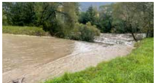
geordneter Rückfluss des Hochwassers in die Mürz von den Überflutzonen